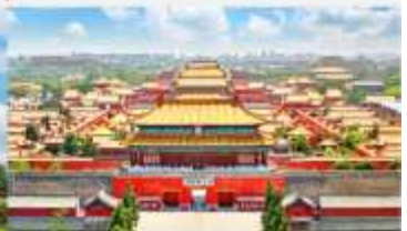
พระราชวังต้องห้ามปักกิ่ง

*ทางบริษัทฯ ขอสงวนสิทธิ์ในการสลับโปรแกรมทัวร์ตามความเหมาะสมขึ้นอยู่กับสถานการณ์หน้างาน โดยคำนึงถึงผลประโยชน์ของลูกค้าเป็นสำคัญ