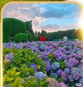
ดอกไม้ตามฤดูกาล