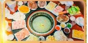
สุกี้เห็ด