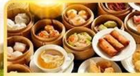
อาหารกวางตุ้ง