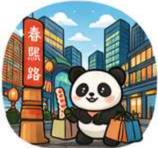
ถนนคนเดินชุนซีลู่ (Chunxi Road)

จากนั้นอิสระท่าน ถนนคนเดินชุนซีลู่ ย่านช้อปปิ้งชื่อดังและคึกคักที่สุดของเฉิงตู เต็มไปด้วยห้างสรรพสินค้า ร้านแบรนด์ดัง ร้านอาหาร และสตรีทฟู้ด เหมาะสำหรับช้อปปิ้งและสัมผัสวิถีชีวิตคนเมือง และ ถนนคนเดินไท่กู่หลี่ แหล่งช้อปปิ้งไลฟ์สไตล์สุดทันสมัย ผสมผสานสถาปัตยกรรมจีนโบราณกับดีไซน์โมเดิร์นอย่างลงตัว รายล้อมด้วยร้านค้าแบรนด์ดัง คาเฟ่ และมุมถ่ายรูปสวยๆ มากมาย