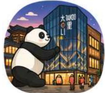
ถนนคนเดินไท่กู่หลี่ (Taikoo Li)

จากนั้นอิสระท่าน ถนนคนเดินชุนซีลู่ ย่านช้อปปิ้งชื่อดังและคึกคักที่สุดของเฉิงตู เต็มไปด้วยห้างสรรพสินค้า ร้านแบรนด์ดัง ร้านอาหาร และสตรีทฟู้ด เหมาะสำหรับช้อปปิ้งและสัมผัสวิถีชีวิตคนเมือง และ ถนนคนเดินไท่กู่หลี่ แหล่งช้อปปิ้งไลฟ์สไตล์สุดทันสมัย ผสมผสานสถาปัตยกรรมจีนโบราณกับดีไซน์โมเดิร์นอย่างลงตัว รายล้อมด้วยร้านค้าแบรนด์ดัง คาเฟ่ และมุมถ่ายรูปสวยๆ มากมาย