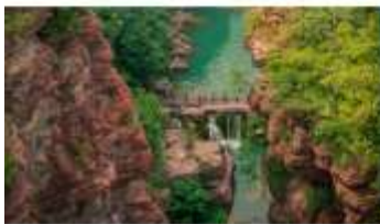
อุทยานสวรรค์หุยนโตซาน