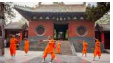
ชมโชว์กังฟูเส้าหลิน

*ทางบริษัทฯ ขอสงวนสิทธิ์ในการสลับโปรแกรมทัวร์ตามความเหมาะสมขึ้นอยู่กับสถานการณ์หน้างาน โดยคำนึงถึงผลประโยชน์ของลูกค้าเป็นสำคัญ