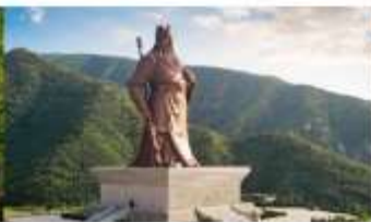
บ้านเกิดกวนอู