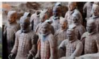
สุสานทหารจีนซี