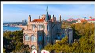
ป่าตึกวน

พระราชวังฤดูร้อน - วิวเมืองชิงเต่า รถไฟความเร็วสูง - ภูเขาเหลาซาน กำแพงเมืองจีนด่านจวิยงกวน - ป่าตึกวน พักโรงแรมระดับ 4 ดาว - ไม่ลงร้านช้อปปิ้ง มือพิเศษ เปิดปักกิ่ง , หม้อไฟซีฟู้ด