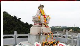
พระเจ้าตากสิน