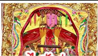
ไฮตั้งมา

มรดกโลกบ้านดินตุ๋นไหลเวียนไหลเต็ง - สะพานเซียงจิว ไฮตั้งมา (เจ้าแม่ทับทิม) - เหยิงบูชิว (เจ้าพ่อเสื่อ) พระเจ้าตากสินมหาธาตุ - อวนน้ำแร่จากธรรมชาติ ไม่ลงร้านช้อปปิ้ง - พักโรงแรม 4 ดาว เมนูพิเศษ!!! อาหารแต้จิ๋ว 18 อย่าง, สุกีชีฟู๊ด ผ่านพะไลต้นตำรับแต้จิ๋ว