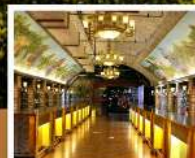
พิพิธภัณฑ์ไวน์ชิงต้า