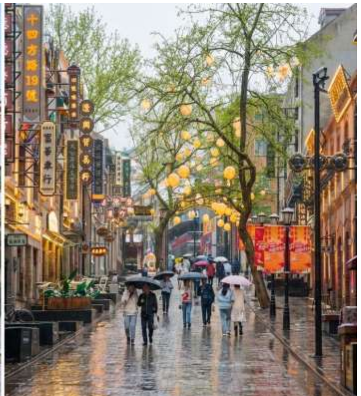
บ่าย นำท่าน เช็คอินย่านเมืองเก่าเยอรมัน เริ่มต้นที่ ตรอกกว้างซิงหลี จุดเช็คอินสุดฮิปแห่งซิงเต่าที่ลมหายใจแห่งอดีตยังมีชีวิต ย้อนเวลากลับไปในซิงเต่าเมื่อร้อยกว่าปีก่อน ที่นี่คือย่านเก่าแก่ที่ถูกปลูกให้กลับมามีชีวิตชีวาวี้อีกครั้ง กลายเป็นแหล่งรวมตัวของเหล่าฮิปสเตอร์และนักท่องเที่ยวที่ต้องการสัมผัสเสน่ห์ที่ไม่