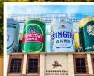
พิพิธภัณฑ์เบียร์ชิงต้า