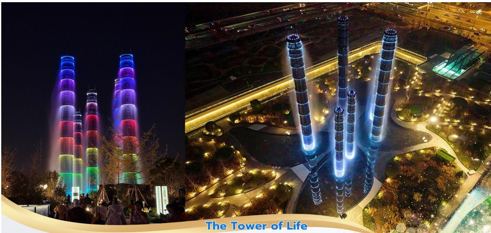
The Tower of Life

สมควรแก่เวลา นำท่านเดินทางสู่ สนามบินเมืองเทียนฟู่ เดินทางกลับสู่ ประเทศไทย