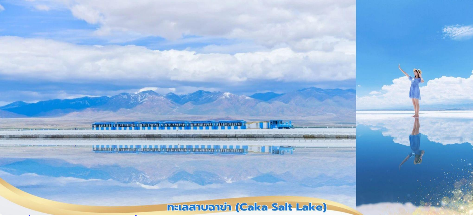
ทะเลสาบจาช่า (Caka Salt Lake)

คำ ที่พิก บริการอาหารคำ ณ ภัตตาคาร Hong Cheng International Hotel ระดับ 4* หรือเทียบเท่า