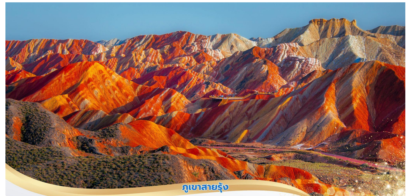
ภูเขาสายรุ้ง

บ่าย นำท่านเที่ยวชม อุทยานภูเขาสายรุ้ง (รวมรถกอล์ฟ) ในเขตอุทยานมีภูเขาหินทรายสีแดงที่เกิดจากการเคลื่อนตัวของเปลือกโลกที่กินเวลานานหลายร้อยล้านปี จนกลายเป็นลักษณะภูมิประเทศที่มีรูปปลักชนันต์ แปลกประหลาดและสีสันหลากหลายสายรุ้ง เป็นประติมากรรมทางธรรมชาติที่ยิ่งใหญ่ สวยงามเหนือคำบรรยาย พื้นที่อุทยานครอบคลุมพื้นที่ราว 300 ตารางกิโลเมตร ประกอบด้วยภูเขาหินทรายสีแดงสด และสีแดงน้ำตาล ที่มีระดับความเข้มนของสีที่แตกต่างกันนับพันยอด นำท่านนั่งรถกอล์ฟของอุทยานแวะเที่ยวตามจุดชมวิวที่เป็นไฮไลต์สำคัญต่างๆ ในอุทยาน โดยในจุดชมวิวทุกจุดจะมีทางบันไดขึ้น ลงและระเบียงทางเดินเพื่อให้นักท่องเที่ยวสามารถเดินชม และถ่ายภาพได้อย่างสะดวก ปลอดภัย