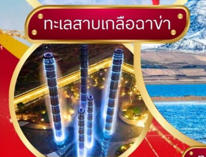
The Tower of Life