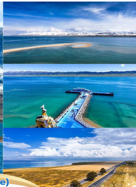
ทะเลสาบซิงไห่ (Qinghai Lake)