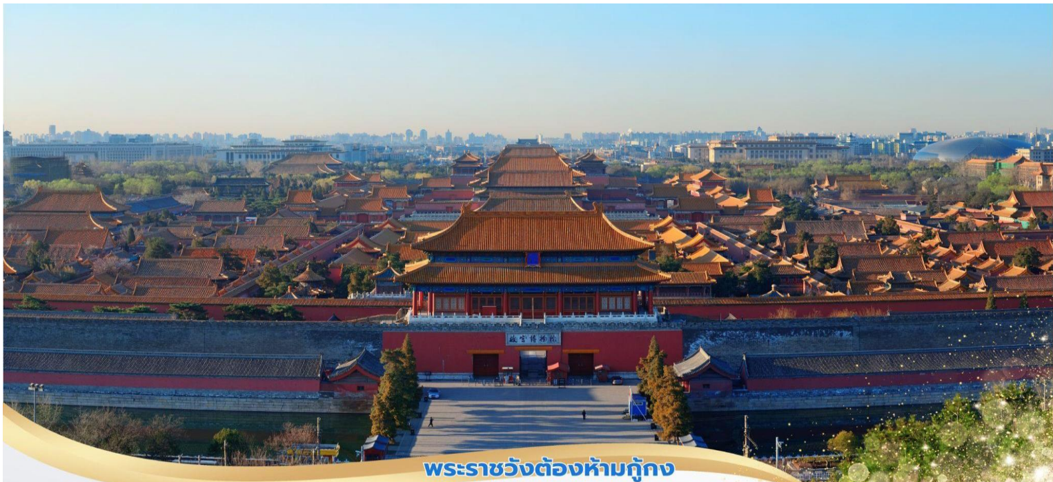
พระราชวังต้องห้ามกู้กง

จากนั้นนำท่านเดินเข้าสู่ พระราชวังกู้กง สร้างขึ้นในสมัยจักรพรรดิหย่งเล่อแห่งราชวงศ์หมิง เป็นถิ่นฐานและชีวิตของจักรพรรดิในราชวงศ์หมิงและชิงรวมทั้งสิ้น 24 พระองค์ พระราชวังเก่าแก่ที่มีประวัติศาสตร์ยาวนานกว่า 500 ปี มีชื่อในภาษาจีนว่า 'กู้กง' หมายถึงพระราชวังเดิม มีชื่อเรียกอีกอย่างหนึ่งว่า 'จื่อจินเจิง' ซึ่งแปลว่า 'พระราชวังต้องห้าม' เหตุที่เรียกพระราชวังต้องห้าม เนื่องมาจากชาวจีนถือคติในการสร้างวังว่า จักรพรรดิ