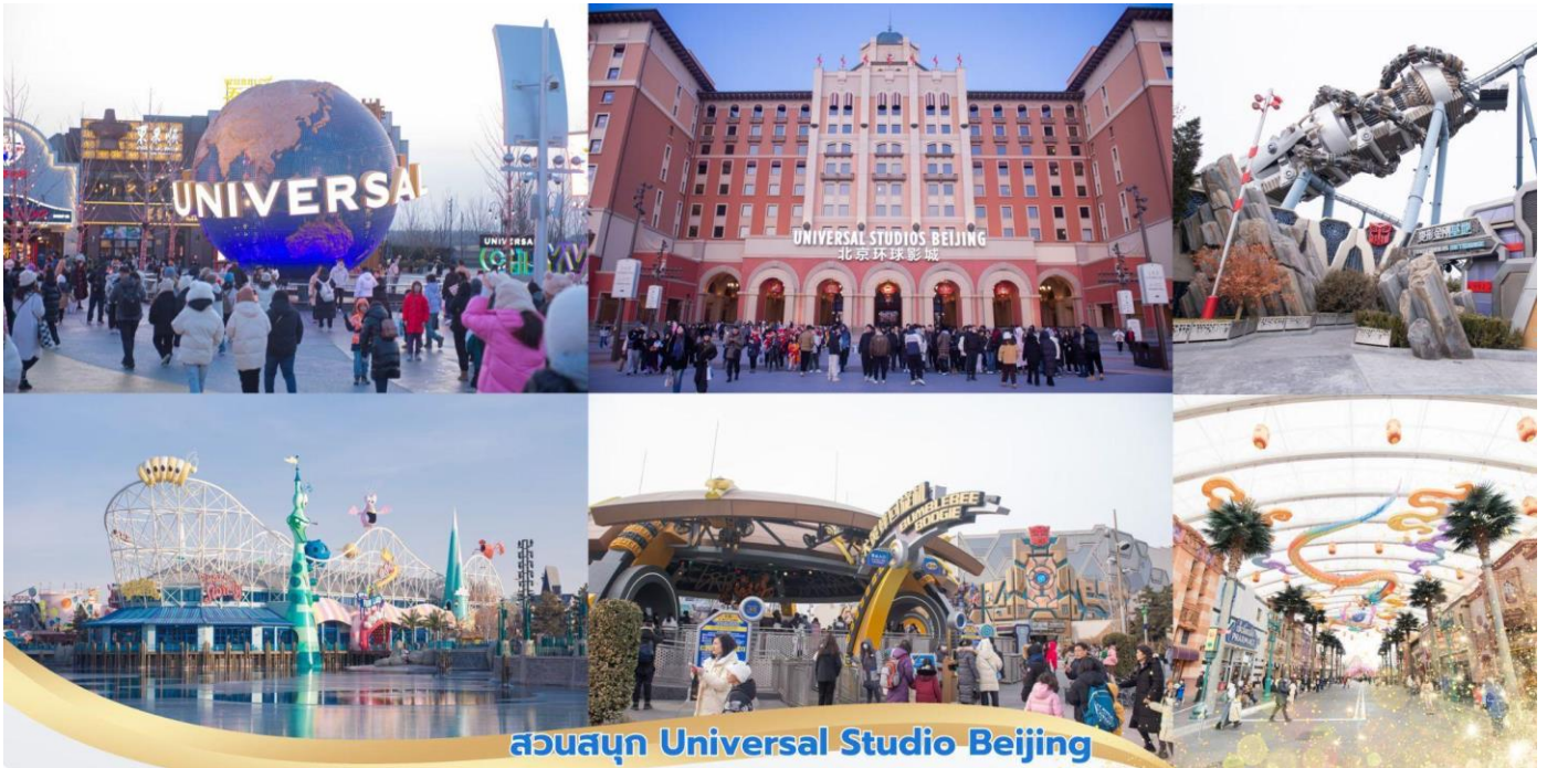
สวนสนุก Universal Studio Beijing