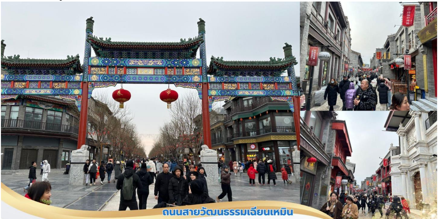
ถนนสายวัฒนธรรมเจียนเหมิน

บาย จากนั้นเดินทางไปยังถนนคนเดินสายวัฒนธรรม เจียนเหมิน ถนนเจียนเหมินย่านการค้าแหล่งใหญ่ด้านหน้า มีซุ้มประตูไม้ห้าช่องขนาดใหญ่ มีประวัติมายาวนานกว่า 600 ปี สมัยราชวงศ์ซิง ถนนการค้านี้เป็นถนนเส้นตรงสองข้างทางเป็นอาคารทรงโบราณสองชั้น ผนังเป็นสีเทาตามลักษณะสถาปัตยกรรมโบราณ ตกแต่งด้วยกระเบื้องสีเขียวและสีแดง อาคารโบราณเกือบทั้งหมดถูกดัดแปลงเป็นร้านค้า เช่น ร้านกาแฟ ร้านขายของฝาก ร้านขายสินค้า นำโชค ร้านถ่ายรูปโบราณ ร้านขายสินค้าหัตถกรรม ร้านขายเสื้อผ้า และร้านขายอาหาร