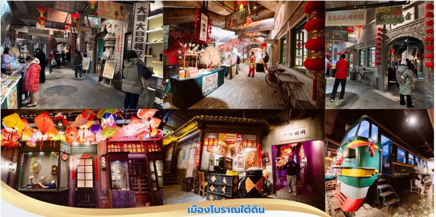
เมืองโบราณใต้ดิน

นำท่านชม เมืองโบราณใต้ดิน อยู่ภายในห้างหวังฝูจิ่ง เป็นการจำลองกรุงปักกิ่งในช่วงของทศวรรษที่ 1980 และ 1990 ภายในเมืองโบราณจะมีสถานีรถไฟเก่า หัวยุทธจักรดีเซล Dongfeng เป็นหนึ่งในหัวยุทธจักรดีเซล ที่ใช้กับการรถไฟของจีน และเป็นรุ่นตัวแทนของหัวยุทธจักรดีเซลขับเคลื่อนด้วยไฟฟ้ารุ่นแรกในจีน เป็นจุด เช็กอินใหม่ให้ท่านได้เลือกถ่ายรูป