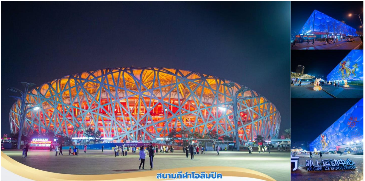
สนามกีฬาโอลิมปิก

จากนั้นนำท่านแวะถ่ายรูปบริเวณด้านหน้า สนามกีฬาโอลิมปิกกรุงปักกิ่ง สนามกีฬาโอลิมปิกกรุงปักกิ่งออกแบบโดยสถาปนิกชาวสวิสเซอร์แลนด์ Herzog & de Meuron เดินตามรอยสนามกีฬาชื่อดังของโลก “โคลอสเซียม” พยายามให้อื้ออามวยต่อสิ่งแวดล้อม ในสนามจุได้ 91,000 ที่นั่ง ใช้จัดพิธีเปิด-ปิดการแข่งขันโอลิมปิก 2008 มีลักษณะภายนอกคล้ายกับ “รังนก” ที่มีโครงตาข่ายเหล็กเหมือนกิ่งไม้ เพดานและผนังอาคารที่ทำด้วยวัสดุโปร่งใส ทัศนจันทร์มีลักษณะรูปทรงขามสีแดง ดูคล้ายกับพระราชวังต้องห้ามของจีน ซึ่งให้กลิ่นอายงดงามแบบตะวันออก ผ่านชมสระว่ายน้ำแห่งชาติ สระว่ายน้ำแห่งชาติ สร้างขึ้นเหนือจินตนาการคล้าย “ก้อนน้ำสี่เหลี่ยมขนาดใหญ่” ซึ่ง PTW and Ove Arup ออกแบบโดยใช้วัสดุเทฟลอนทำเป็นโครงร่าง เน้นใช้พลังงานแสงอาทิตย์เพื่อให้ดูเหมือนน้ำที่สุด และใช้เทคโนโลยีจากงานวิจัยของนักฟิสิกส์จาก Dublin’s Trinity College ที่ทำให้กำแพงอาคารดูเหมือนฟองน้ำที่เคลื่อนไหวอยู่ตลอดเวลา