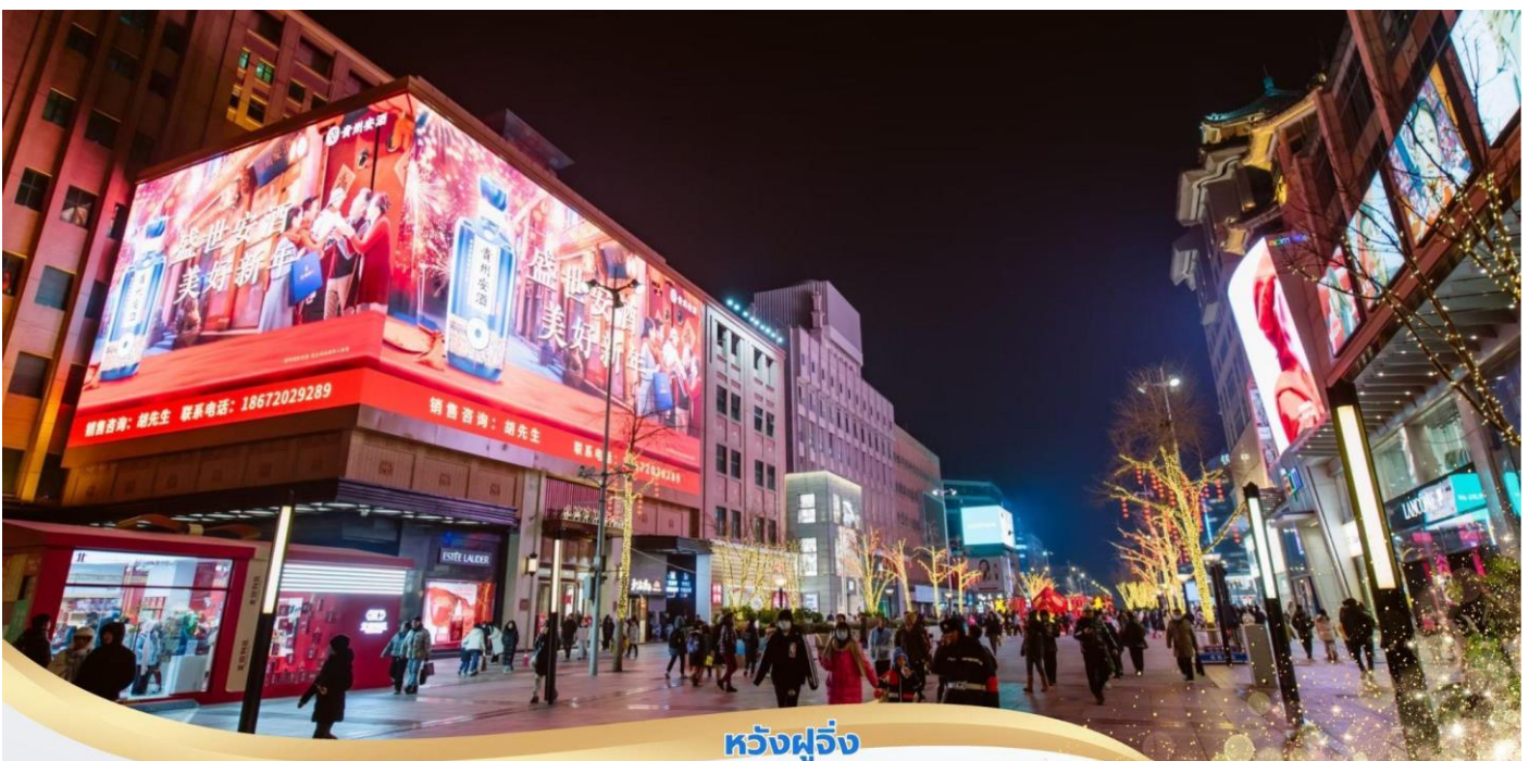
หวังฝูจิ่ง

จากนั้นนำท่านเดินทางสู่ ถนนหวังฝูจิ่ง ถนนช้อปปิ้งที่เก่าแก่ที่สุดและมีชื่อเสียงที่สุดในกรุงปักกิ่ง เป็นจุดท่องเที่ยวที่พลาดไม่ได้เมื่อมาเยือนเมืองปักกิ่ง มีสินค้าให้เลือกชม เลือกช้อป อาทิเช่น เสื้อผ้า ของใช้รวม