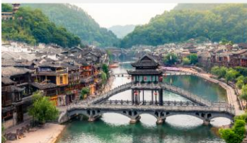
เมืองโบราณเฟิงหวง