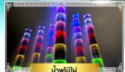
น้ำพุไม้ไฟ