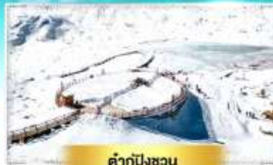
คำกู่ปิงชว่น