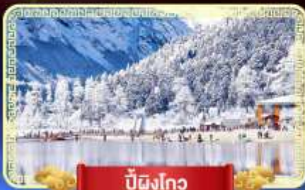
ปี้มิงโกว

สัมปัสสวรรค์บนดินแห่งเมืองจีน เที่ยวสุดคุ้ม 3 อุทยานทางธรรมชาติ