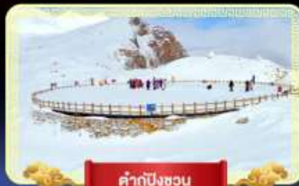
ต้ากู่ปิงชอน