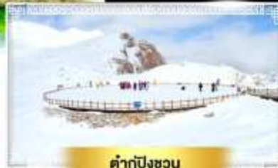
คำกู่ปิงชวณ