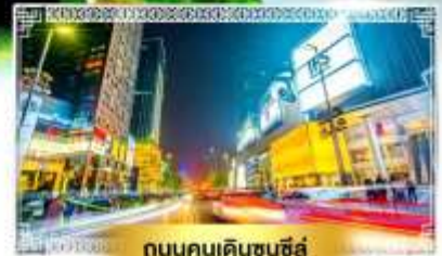
ถนนคนเดินชุนซีลู่