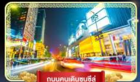
ถนนคนเดินชุนชี่ลู่