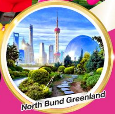
North Bund Greenland