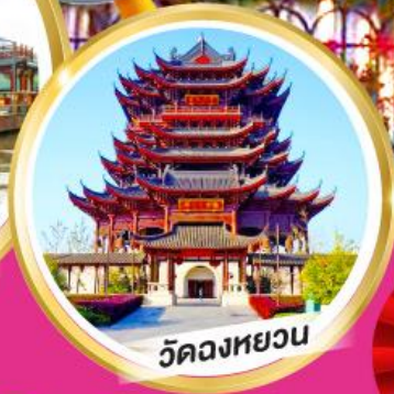
วัดหลงหยวน