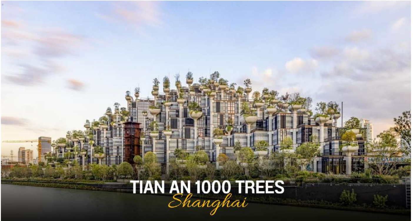
TIAN AN 1000 TREES Shanghai