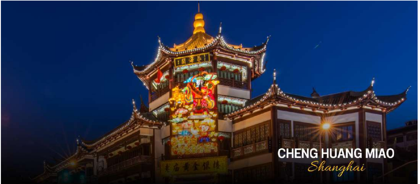
CHENG HUANG MIAO Shanghai