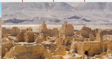
เมืองโบราณเกาซาง