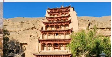
ชมถ้ำหินมั่วเกาฉู่