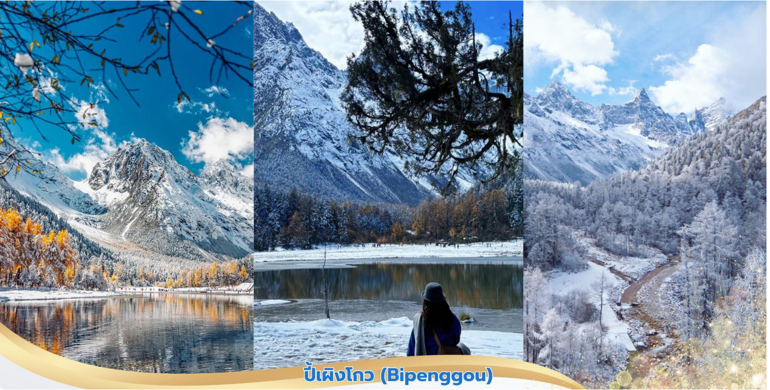
บิ่เต็งโกว (Bipenggou)