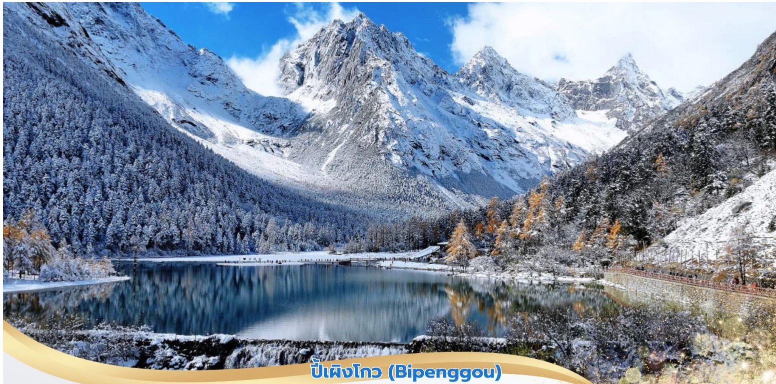
บีเฟิงโกว (Bipenggou)

เช้า บริการอาหารเช้า ณ ห้องอาหารของโรงแรม นำท่านเดินทางสู่ อำเภอหลี่เสียน ใช้เวลาเดินทางประมาณ 2 ชั่วโมง ให้ท่านได้อิสระชมวิวกาศทัศน์ภาพ อันสวยงามระหว่างการเดินทาง เที่ยง บริการอาหารกลางวัน ณ ภัตตาคาร