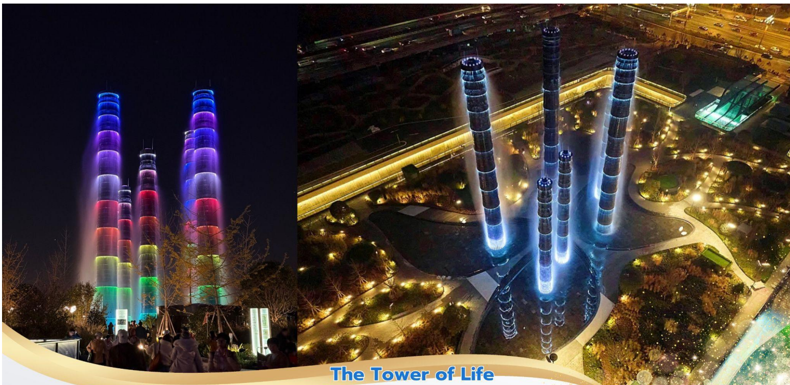
The Tower of Life

ที่พัก HOLIDAYINN EXPRESS HOTEL ระดับ 4* หรือเทียบเท่า