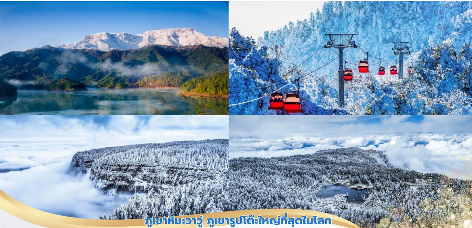
ภูเขาหิมะวางู๋ ภูเขารูปโต๊ะใหญ่ที่สุดในโลก