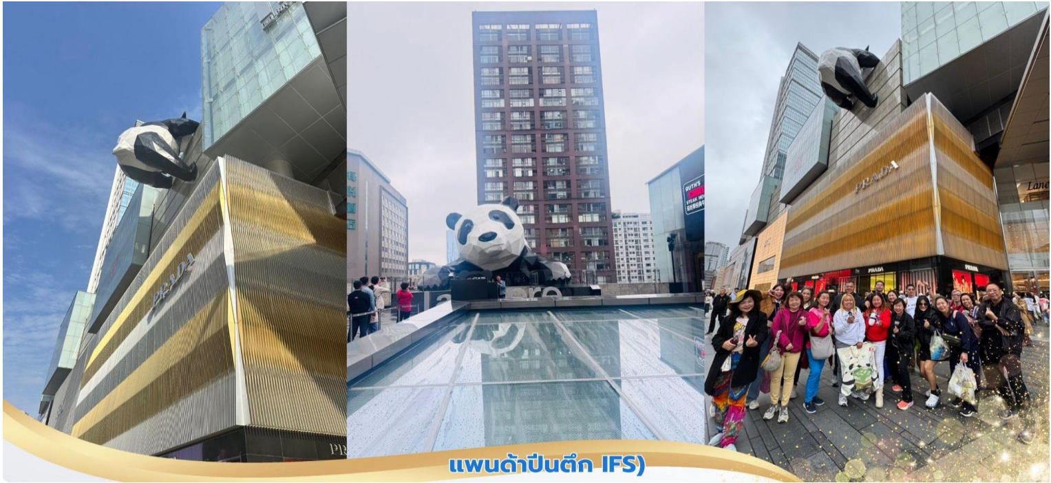
แพนด้าปิ่นตึก IFS)

ป้าย จากนั้นนำท่านสู่ ถนนคนเดินชุนซี้ลุ เป็นย่านวัยรุ่นเปรียบได้กับสยามสแคว์ ซึ่งขายสินค้า ที่ทันสมัยเป็นถนนที่ปิด ไม่ให้รถวิ่งผ่านได้ ห้างดังในย่านนี้มีให้เลือกช้อปปิ้งมากมายหลากหลาย จากนั้นนำท่านชม หมีแพนด้ายักษ์ กำลังปิ่นตึก IFS เป็นอีกหนึ่งแลนด์มาร์ค ที่ใครมาเจียงตูแล้วต้องมาเช็กอิน อีสาระเลือกช้อปปิ้ง ไอเท็มสุดฮิตที่ร้าน POP MART สายสะสมน้อง Labubu ไม่ควรพลาด