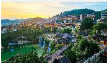
เมืองโบราณฟูหรงเจิน