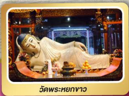
วัดพระหยกขาว

พิเศษ ทานบะหมี่ปู ร้าน Michelin Shanghai No.1