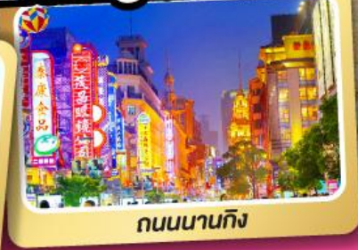
ถนนนานกิง