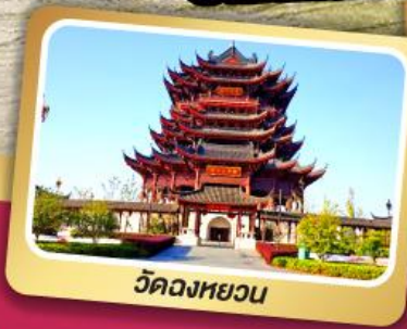
วัดฉงหยวน