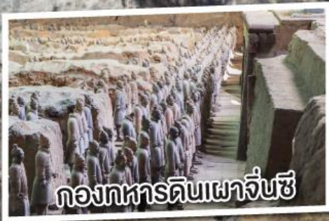
กองทหารดินเผาจีนซี