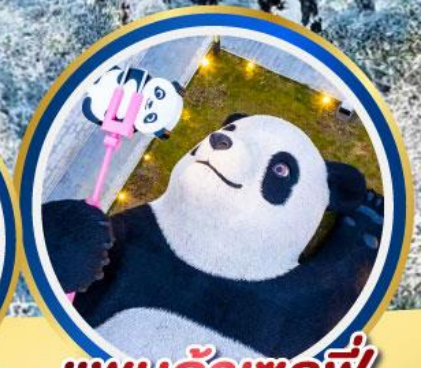
แพนด้าเซลฟี่