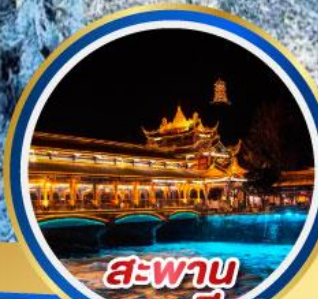
สะพาน หนานเฉียว