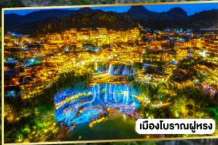
เมืองโบราณฝูหลง