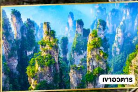
เขาวงตาร