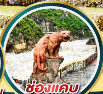
ช่องแคบ เสื่อกระโจน