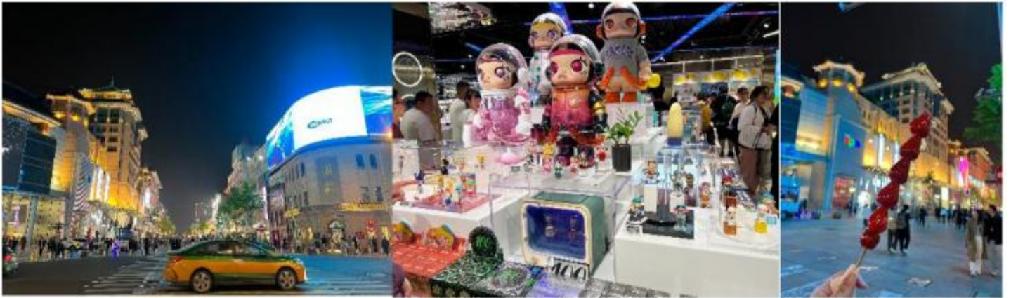
ในเอกลักษณ์และสีสันอันคึกคักของเมืองปักกิ่ง

จากนั้นให้ทุกท่านได้เดินช้อปปิ้ง ถนนหวังฝูจิ่ง เป็นตลาดถนนคนเดินแห่งเมืองปักกิ่ง เป็นถนนที่รวบรวมเอาสินค้าอันหลากหลายและเป็นสตรีทฟู้ด ไม่ว่าจะเป็นอาหารที่มีทั้งของขึ้นชื่อยอดนิยมนของชาวจีน ไปจนอาหารแปลกตาที่หารับประทานไม่ได้ที่อื่น และของใช้ เสื้อผ้า ถือได้ว่าเป็นหนึ่ง