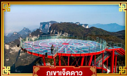
กุเงาเจ็ดดาว