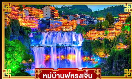
หมู่บ้านฟุรงเจิน