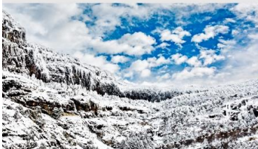
ภูเขาหิมะเจียวจื่อ