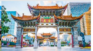
ประตู่ม้าทอง ไถ่หยก