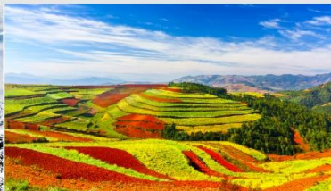
แผ่นดินสีแดง