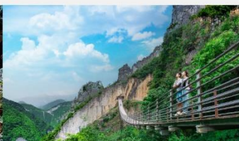
หุบเขารอยแยกอุ๋หลิงซาน