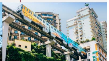
รถไฟฟ้าทะเลตึก

*ทางบริษัทฯ ขอสงวนสิทธิ์ในการสลับโปรแกรมทัวร์ตามความเหมาะสมขึ้นอยู่กับสถานการณ์หน้างาน โดยคำนึงถึงผลประโยชน์ของลูกค้าเป็นสำคัญ