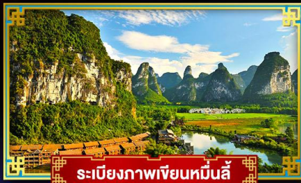
ระเบียบภาพเขียนหมื่นลี้