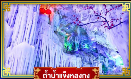
ตำนานเจิ้งหลงกง

สุดอลังการ น้ำตก 2 พรหมแดน แหล่งท่องเที่ยวระดับ 5A