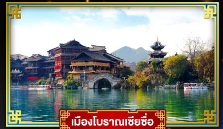
เมืองโบราณเซี่ยซือ