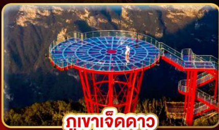
ภูเขาจิดดาว