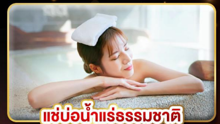
แช่น้ำแร่ธรรมชาติ