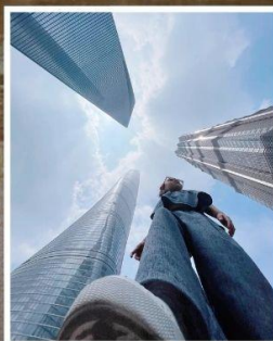
3 ตึกใหญ่ แห่งเมืองไฮ้