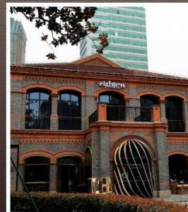
ย่านเฟิงเซินหลี่