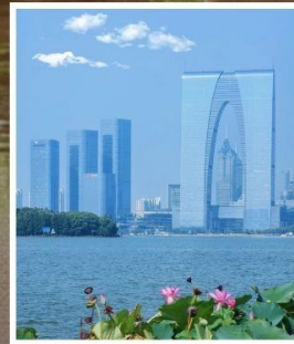
SUZHOU EAST GATE