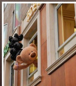
ถนนอันฟู่