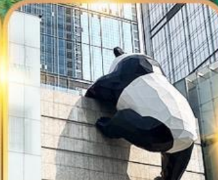
แพนด้าปีนตึก