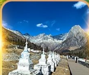
สวิตเซอร์แลนด์แดนมังกร