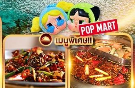
อาหารเสฉวน