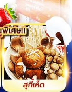
สุกี้เห็ด