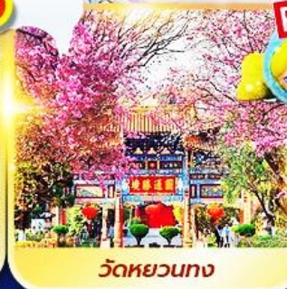
วัดหยวนทง