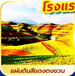
แผ่นดินสีแดงตงชวน