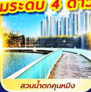
สวนน้ำตกคุณหมิง