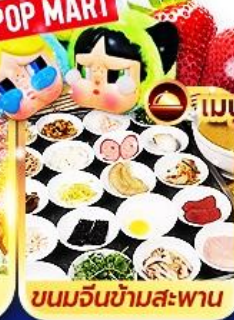
ขนมจีนข้ามสะพาน