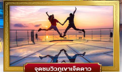
จุดชมวิวกูเขาเจ็ดดาว