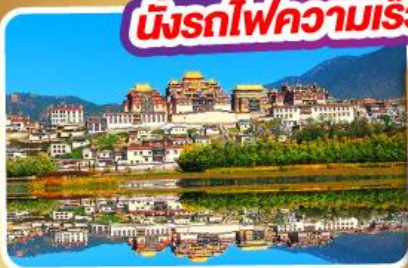
วัดลามะ-ชงจ้านหลิง