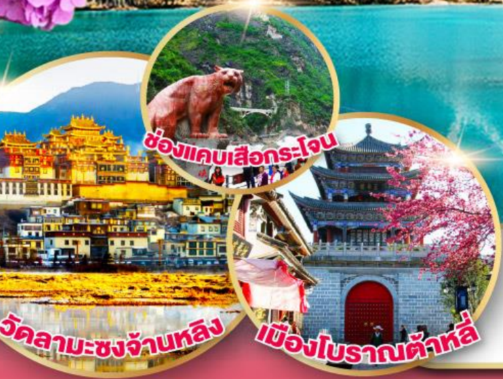
ฮองแคบเสือกระโจน