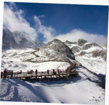
ภูเขาหิมะมังกรหยก