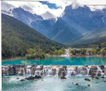
หุบเขาพระจันทร์สีน้ำเงิน