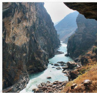
ช่องแคบเสือกระโดด