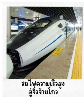
รถไฟความเร็วสูง สู่จิวจ้ายโกว