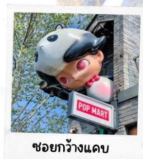
ชอยกว้างแดบ