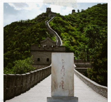
กำแพงเมืองจีน ด่านจวิหยงกวน