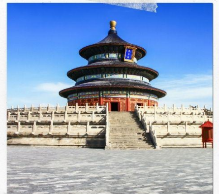
หอบูชาเทียนถาน