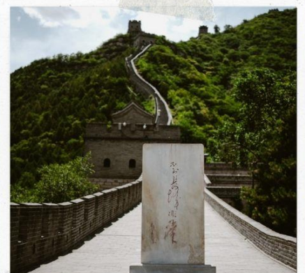
กำแพงเมืองจีน ด่านจวิหยงกวน