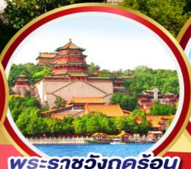
พระราชวังฤดูร้อน อิ๋นโฮยวน