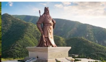
บ้านเกิดท่านกวนอู