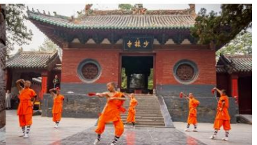
ชมโชว์กังฟูเส้าหลิน

*ทางบริษัทฯ ขอสงวนสิทธิ์ในการสลับโปรแกรมทัวร์ตามความเหมาะสมขึ้นอยู่กับสถานการณ์หน้างาน โดยคำนึงถึงผลประโยชน์ของลูกค้าเป็นสำคัญ