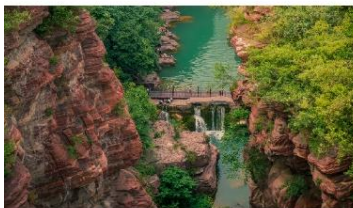
อุทยานสวรรค์หยุนโถซาน