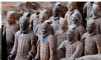
สุสานทหารจีนซี