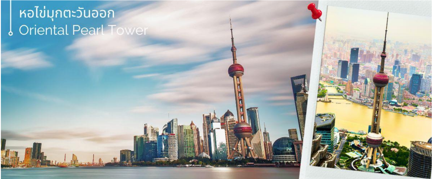
หอไข่มุกตะวันออก Oriental Pearl Tower

จากนั้นนำท่านเดินทางสู่แลนด์มาร์คของเมืองเซี่ยงไฮ้ นักท่องเที่ยวทั้งชาวจีนและชาวต่างชาติ ต่างพากันมาถ่ายรูปอย่างไม่ขาดสาย เมื่อมาถึงเมืองเซี่ยงไฮ้ นั่นคือ หอไข่มุกตะวันออก Oriental Pearl Tower (ชั้นชม) เป็นหอส่งสัญญาณวิทยุโทรทัศน์สูง 468 เมตร ลักษณะเป็นไข่มุก 11 ลูก และ เสา 3 เสา ด้านบนเป็นรูปไข่มุก 3 เม็ด 3 ขนาดเรียงกันในแนวตั้ง เมื่อชมวิว ถ่ายรูปกันจนพอใจแล้ว นำท่านเดินมาทางเข้าอุโมงค์เลเซอร์ ซึ่งเป็นอุโมงค์ลอดแม่น้ำแห่งแรกในประเทศจีนโดยอุโมงค์นี้จะพาเราเดินทางข้ามจากฝั่งหอไข่มุกตะวันออก ของหาดไว่ทาน