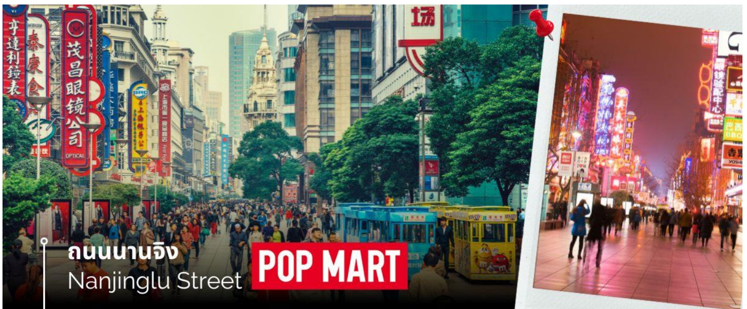
ถนนนานจิง Nanjinglu Street POP MART

จากนั้นนำท่านสู่ ดิก STARBUCKS สาขาใหม่ที่นครเซี่ยงไฮ้ มาพร้อมกับความยิ่งใหญ่อลังการ ครองตำแหน่ง สตาร์บัคส์ที่สวยที่สุดในโลก ซึ่งได้ทำการเปิดตัวไปเมื่อวันที่ 6 ธันวาคม 2560 มีเนื้อที่ใหญ่โตถึง 2,787 ตารางเมตร ด้านบนของร้าน ตกแต่งด้วยแผ่นไม้รูปทรงแหลมซึ่งเป็นงานแฮนด์เมดจำนวน 10,000 แผ่น และที่ตั้งตระหง่านอยู่กลางร้านคือถึงคั่วกาแฟทองเหลืองขนาด 40 ตัน สูงเท่าตึก 2 ชั้น ประดับประดาด้วยแผ่นตราประทับแบบเงินโบราณมากกว่า 1,000 แผ่น ซึ่งบอกเล่าเรื่องราวความเป็นมาของสตาร์บัคส์