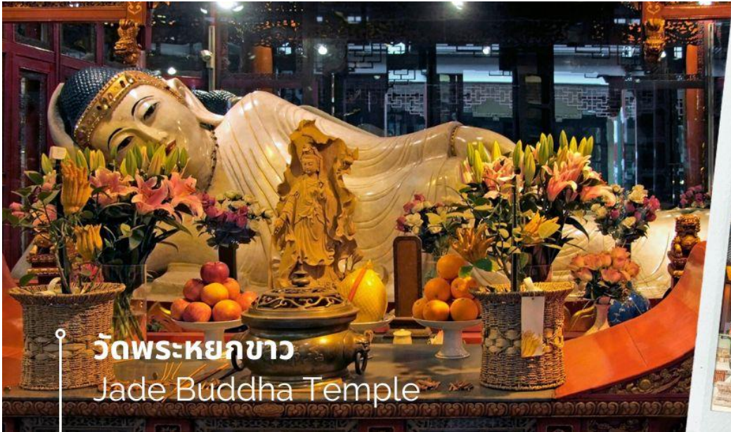
วัดพระหยกขาว Jade Buddha Temple

นำท่านชม วัดพระหยกขาว Jade Buddha Temple เป็นวัดที่มีชื่อเสียงมากที่สุดในเมืองเซี่ยงไฮ้ ซึ่งเป็นที่รู้จักจากพระพุทธรูปสององค์ที่สร้างขึ้นจากหยกทั้งแท่ง องค์พระพุทธรูปปางนั่งมีความสูง 190 เซนติเมตร และ หุ้มด้วยเพชรพลอย หิน มอโนรา และ มรกต และองค์พระพุทธรูปปางไสยาสน์ มีความยาว 96 เซนติเมตร นอนเอียงด้านขวาและหนุนพระเศียรด้วยพระหัตถ์ขวา ถือเป็นวัดที่มีทั้งชาวจีนและนักท่องเที่ยวเดินทางมาสักการะบูชาตลอดทั้งวัน