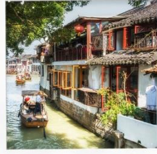
เมืองโบราณจูเจียเจี๋ย