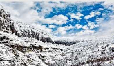
ภูเขาหิมะเจี้ยวจื่อ