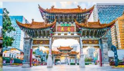
ประตูม้าทอง ไถ่หยก