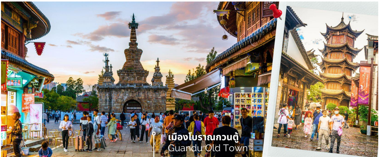
เมืองโบราณกวนตุ๋ Guandu Old Town

นำท่านชมบรรยากาศ เมืองโบราณกวนตุ๋ (Guandu Old Town) เป็นหนึ่งในต้นกำเนิดของวัฒนธรรมยูนนาน และยังถือเป็นหนึ่งในภูมิทัศน์ทางประวัติศาสตร์และวัฒนธรรม ที่สำคัญของเมืองคุนหมิง เมืองโบราณแห่งนี้ยังคงเป็นศูนย์กลางทางการค้าและคมนาคมที่สำคัญ ในอดีตเคยเป็นหมู่บ้านชาวประมงในสมัยราชวงศ์ถัง เมืองกวนตุ๋ยังเป็นเมืองแรกๆ ที่ศาสนาพุทธทางไนทิเบตได้เริ่มเผยแพร่เข้ามาในดินแดนยูนนาน