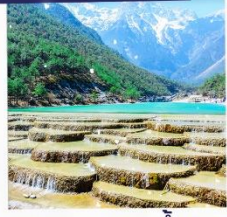
ทะเลสาบธารน้ำขาว รวมรถแบดเจอร์รี่