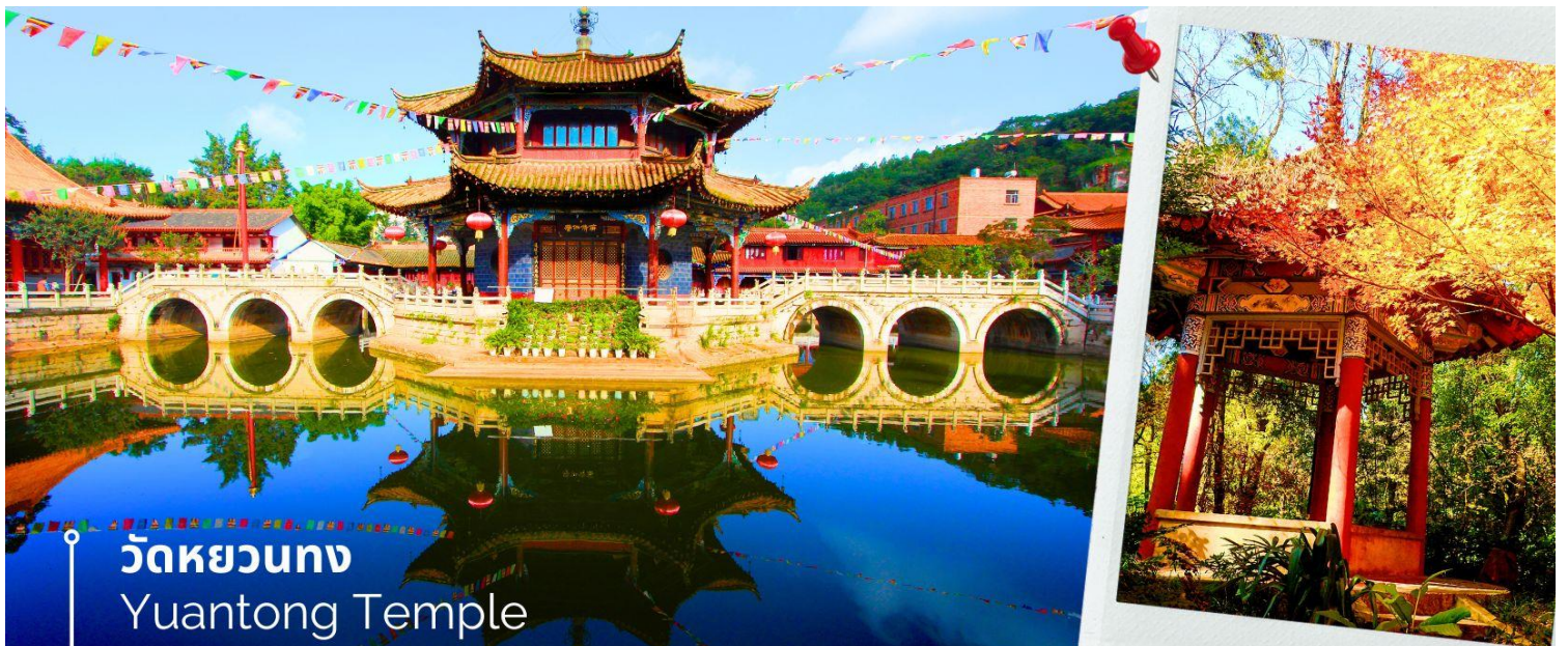
วัดหยวนทง Yuantong Temple

นำท่านชม วัดหยวนทง (Yuantong Temple) วัดแห่งนี้เป็นวัดที่ใหญ่และเก่าแก่ที่สุดในเมืองคุนหมิง สร้างมาตั้งแต่สมัยราชวงศ์ถัง มีอายุยาวนานประมาณ 1,200 กว่าปี การสร้างวัดแห่งนี้จะแปลกตากว่าวัดอื่นในจีน