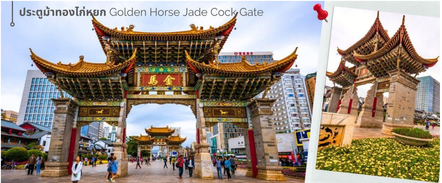
ประตูม้าทองไก่อหยก Golden Horse Jade Cock Gate

เพราะปกติแล้วการสร้างวัดของจีนส่วนมากจะต้องสร้างอยู่บนภูเขา แต่วัดหยวนทงสร้างวัดต่ำกว่าภูเขา โดยวิหารจะอยู่ต่ำที่สุด เนื่องจากวัดแห่งนี้ไม่ได้สร้างขึ้นเพื่อเป็นวัดโดยตรง แต่เคยเป็นศาลเจ้าแม่กวนอิมมาก่อน ชม ซุ้มประตูม้าทอง และ ซุ้มประตูไก่อหยก ซึ่งภาษาจีนเรียกว่าจินหม่า และปี้จี จึงเอาคำย่อ จินปี้ มาชานานนามถนนแห่งนี้ ซุ้มม้าทองและไก่อหยก มีอายุร่วม 400 ปี สร้างขึ้นในสมัยราชวงศ์หมิง ในถนนย่านการค้าแห่งนี้ เป็นแหล่งเสื้อผ้าแบรนด์เนมทั้งของจีนและต่างประเทศ รวมทั้งเครื่องประดับ อัญมณี ร้านเครื่องตี๋ม และร้านขายของที่ระลึกมากมาย