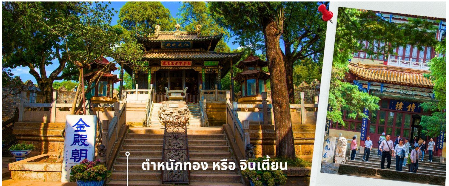
ตำหนักทอง หรือ จินเตี้ยน

นำท่านเยี่ยมชม ตำหนักทอง หรือ จินเตี้ยน (The Golden Temple Park | Jindian park) (ไม่รวมค่ารถแบตเตอร์รี่ 10 หยวน/ท่าน) โบราณสถานสำคัญของมณฑลยูนนาน ที่ได้รับการปกป้องดูแลโดยรัฐบาลจีน ตั้งอยู่บริเวณเชิงเขาหมิงเฟิง ล้อมรอบด้วยแนวกำแพงและหอคอยเหมือนเป็นป้อมปราการ ตำหนักทองถูกเรียกตามลักษณะอาคารที่มีสีทองอร่าม จากทองเหลืองในส่วนของผนังและหลังคา รวมกว่า 200 ตัน โดยถือเป็นสิ่งปลูกสร้างสัมฤทธิ์ที่ใหญ่ที่สุดของจีน ภายในมีรูปปั้นทองโดยมีเงินอยู่ (เสวียนอู่) เทพเจ้าลัทธิเต๋าเป็นองค์ประธาน