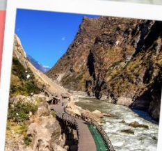
ช่องแคบเสื่อกระโจน รวมบันไดเลื่อน ขึ้น-ลง