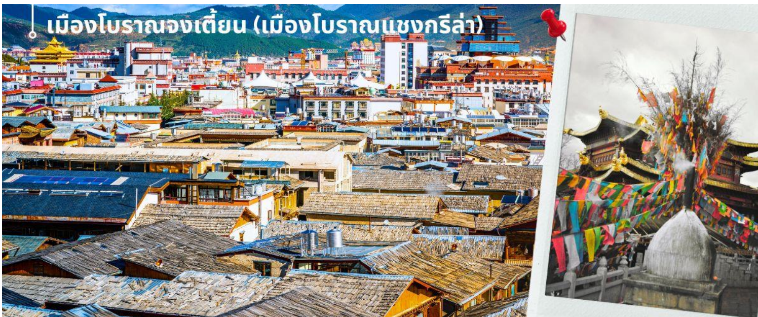
เมืองโบราณจงเตียน (เมืองโบราณแซงกรีล่า)

นำท่านเดินทางสู่ เมืองจงเตียน (แซงกรีล่า) (ใช้เวลาเดินทางประมาณ 5 ชั่วโมง) ซึ่งอยู่ทางทิศตะวันออกเฉียงเหนือของมณฑลยูนนานซึ่งมีพรมแดนติดกับอาณาเขตนาซีของเมืองลี่เจียงและอาณาจักรหิของเมืองหนิงหลง ซึ่งอยู่ห่างจากนครคุนหมิงถึง 700 กิโลเมตร ด้วยภูมิประเทศรวมกับทัศนียภาพที่งดงาม สถานที่แห่งนี้จึงได้ชื่อว่า “ดินแดนแห่งความฝัน” นำท่านชม เมืองโบราณจงเตียน (เมืองโบราณแซงกรีล่า) ตั้งอยู่ใน