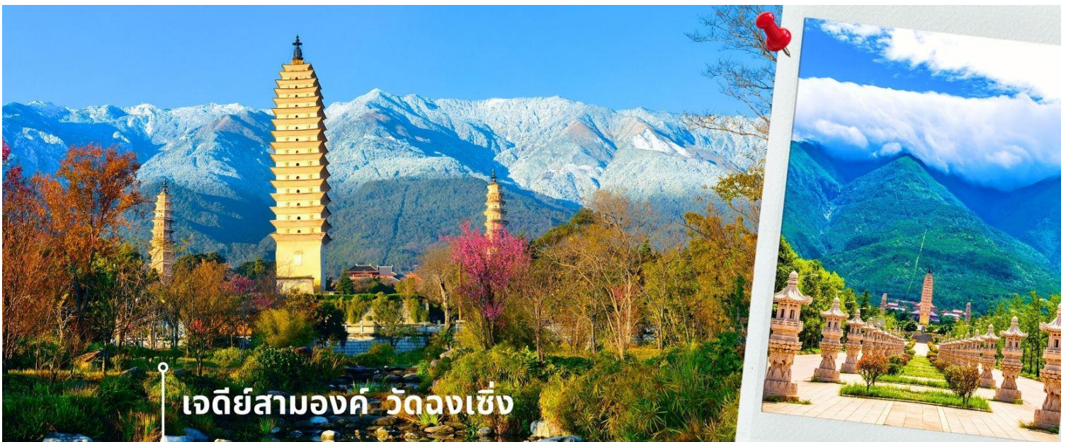
เจดีย์สามองค์ วัดจงเซิง

จากนั้นผ่านชม เจดีย์สามองค์ สัญลักษณ์ของเมืองต้าหลี่ ตั้งอยู่ภายใน วัดจงเซิง (Chongsheng Temple) วัดเก่าแก่ที่สร้างขึ้นเมื่อศตวรรษที่ 9 นับว่าเป็นหนึ่งในเจดีย์ที่สูงที่สุดในประเทศจีน อีกทั้งยังมีความศักดิ์สิทธิ์เป็นอย่างมาก ว่ากันว่าเป็นหนึ่งในสิ่งก่อสร้างเพียงไม่กี่แห่งที่ไม่ถูกทำลายจากเหตุการณ์แผ่นดินไหวในเมืองต้าหลี่เมื่อปี ค.ศ. 1925 จึงกลายเป็นสถานที่เคารพศรัทธาของชาวต้าหลี่เป็นอย่างมาก