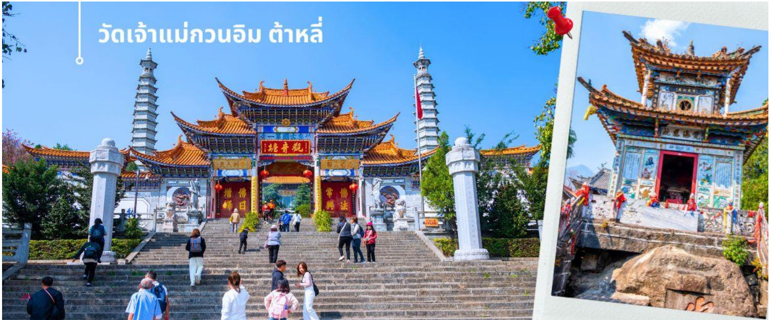
วัดเจ้าแม่กวนอิม ต้าหลี่

นำท่านชม วัดเจ้าแม่กวนอิม (ใช้เวลาเดินทาง 30 นาที) ตามตำนานเล่าว่าเจ้าแม่กวนอิมได้แปลงกายเป็นหญิงชราแบกก้อนหินใหญ่ไว้บนหลังเพื่อให้ทหารของฝ่ายตรงข้ามได้เห็นเมื่อทหารฝ่ายศัตรูได้เห็นว่ามีแม่แต่หญิงชรายังแข็งแรงถึงเพียงนี้ ถ้าเป็นคนวัยหนุ่มสาวจะต้องมีพลังกำลังมากมายยากที่จะต่อสู้ จึงทำให้ไม่ทำการเข้าโจมตีเมืองและถอยทัพกลับไป ชาวเมืองจึงสร้างวัดแห่งนี้ขึ้นในสมัยราชวงศ์ถัง ซึ่งถือว่าเป็นวัดที่มีประติมากรรมยอดเยี่ยมแห่งหนึ่งในต้าหลี่