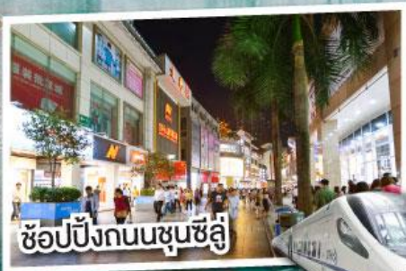
ช้อปปิ้งถนนชุนชี่