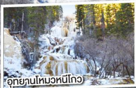
อุทยานโหมวหนี่โกว