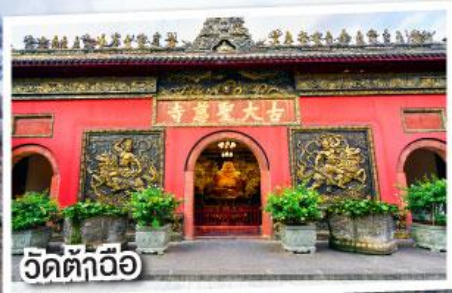
วัดต้าฉือ