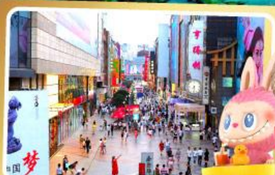
ถนนคนเดินซุนชิลู่