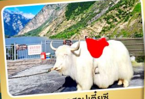
ทะเลสาปเตี้ยซี