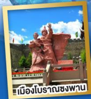
เมืองโบราณชงพาน