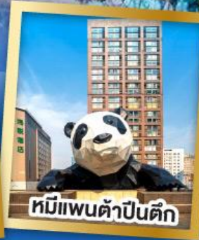
หมีแพนด้าปิ่นตึก