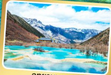
อุทยานหองหลง