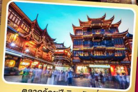
ตลาดร้อยปีเฉิงหวงเหมียว