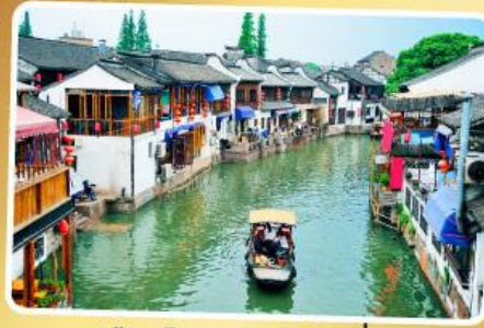
เมืองโบราณจูเจียเจียว