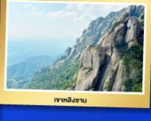
เขาลิงซาน