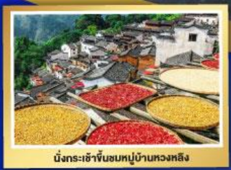
นั้งกระเซ้าซึนซมหมู่บ้านหวงหลิง