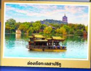
ล่องเรือทะเลสาปซีหู