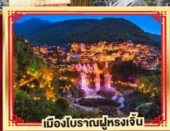
เมืองโบราณฟูหลงจิ้น