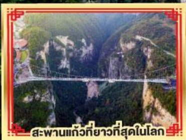
สะพานแกว่งที่ยาวที่สุดในโลก

เขาวงกต เกียนเหมินซาน สองเมืองโบราณ ฟูหลงจิ้น เฟิ่งหวง